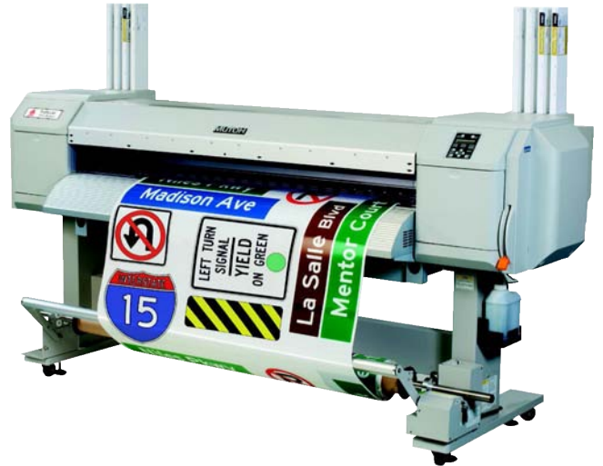
Принтер TrafficJet 1638

Узнайте, как просто, быстро и эффективно изготавливать надежные и прочные дорожные знаки. Полную информацию о системе можно найти на reflective.averydennison.com/TrafficJet