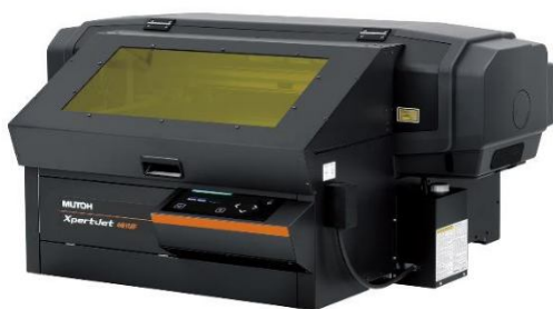
XpertJet 461UF - формат A3+

Два новых настольных УФ-принтера со светодиодной лампой для печати на объектах предлагают повышенную производительность, удобство использования и высокое качество печати, а также они оснащены новой технологией Local Dimming Technology