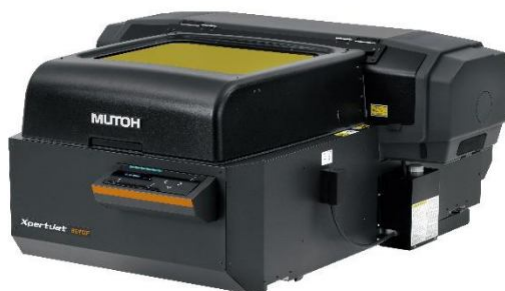
XpertJet 661UF - формат A2+

г.Оостенде, Бельгия. Компания Mutoh Europe NV, подразделение Mutoh Industries Co., Ltd., Япония, сегодня представила два новых настольных компактных 6-ти цветных УФ-принтера со светодиодной лампой для прямой печати на объектах (DTO) - XpertJet 461UF и XpertJet 661UF. Новые цифровые струйные принтеры являются дополнением к существующим моделям планшетных DTO популярных принтеров Mutoh ValueJet 426UF и 626UF.