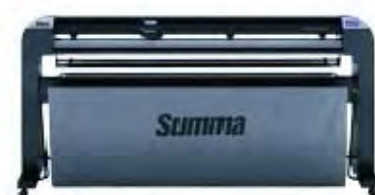
S2 160 Флюгерный или тангенциальный нож