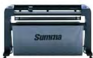
S2 120 Флюгерный или тангенциальный нож