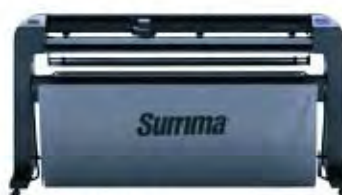
S2 140 Флюгерный или тангенциальный нож