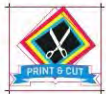
Резка по контуру без функции OPOS