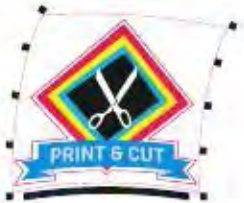
Резка по контуру с функцией OPOS