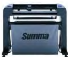
S2 75 Флюгерный или тангенциальный нож